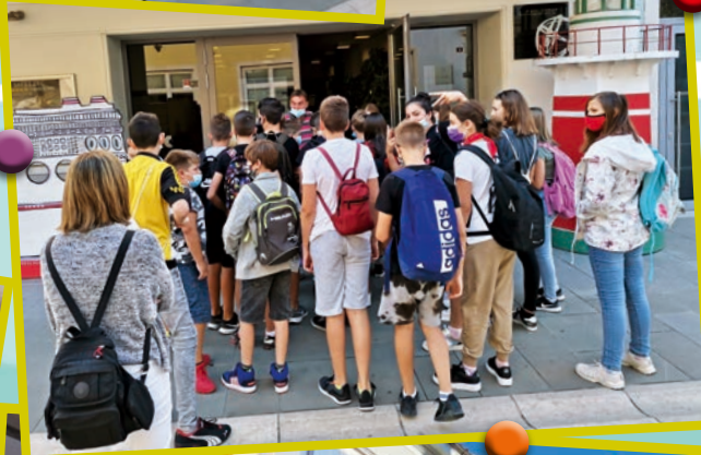
Ilustracija Vedran Muravčić