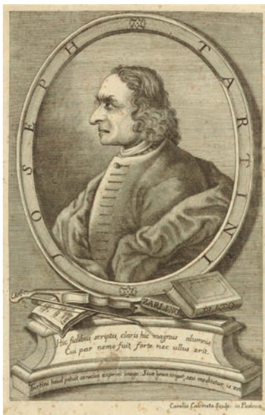
Ritratto di Giuseppe Tartini