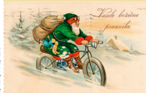
Kamra, objavila Knjižnica Mirana Jarca Novo mesto; 1. polovica 20. stol.; dela v javni domeni

Kmalu nas bodo obiskali trije dobri možje. Mi jih že nestrno pričakujemo, ampak da bi jih lahko sprejeli tako, kot si zaslužijo, jih moramo najprej dobro spoznati. V prvem delu delavnice bomo spoznavali šege v adventnem času, veliko zanimivosti o Miklavžu, Božičku in Dedku mrazu, sledila pa bo ustvarjalna delavnica . Spremljaj našo spletno stran ali profil Facebook in izvedel boš več o delavnici. * Tjaša